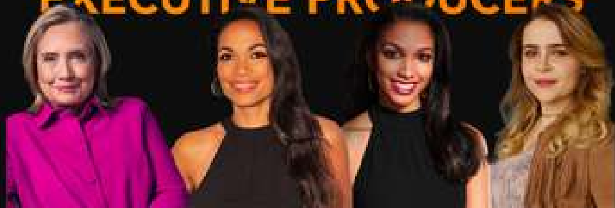
Hillary Rodham Clinton